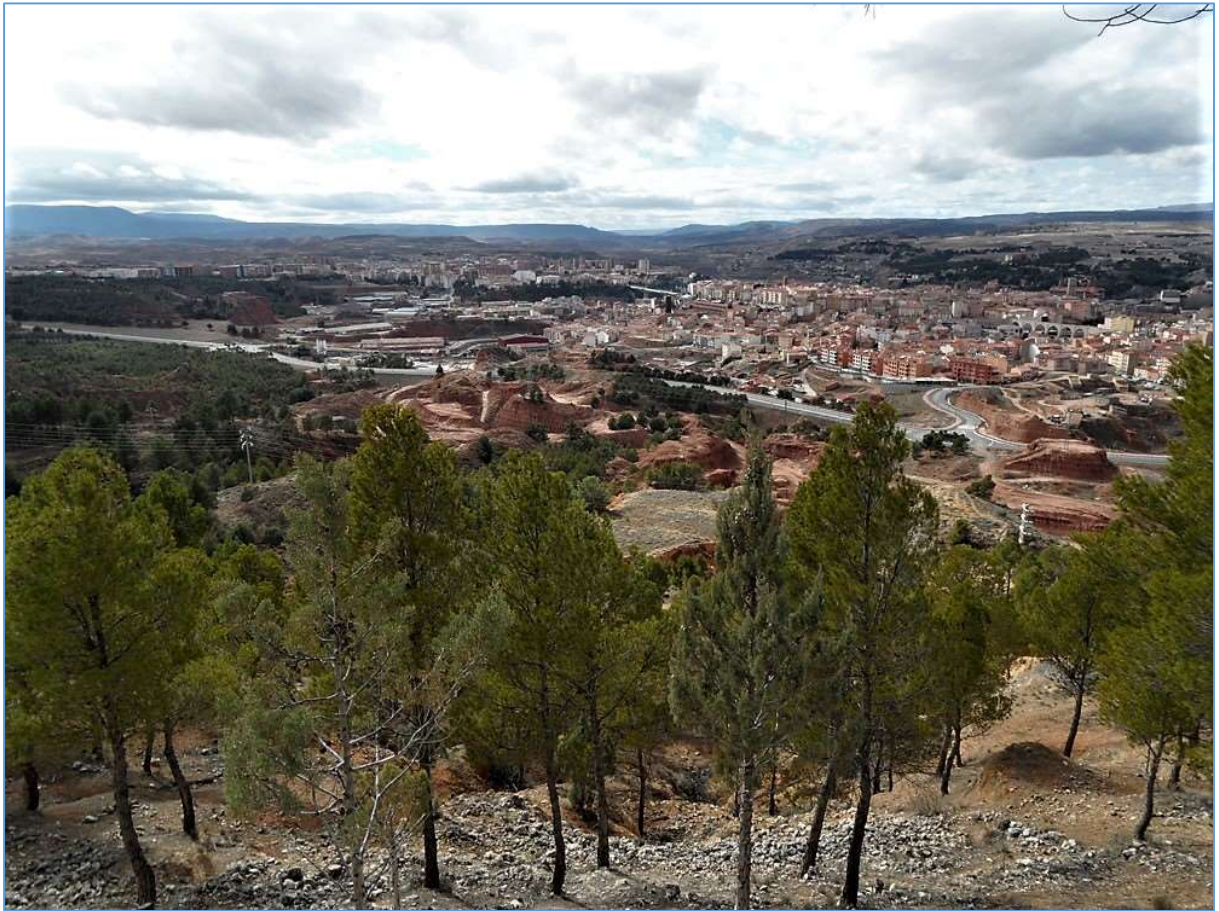
Vista desde el mirador.