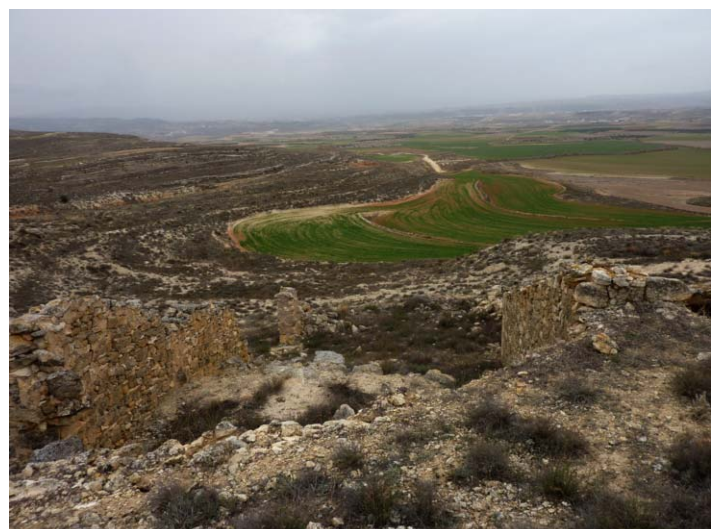
A la izquierda, mural de Conclud (tigres de dientes de sable). A la derecha, vista desde el cerro de la Garita