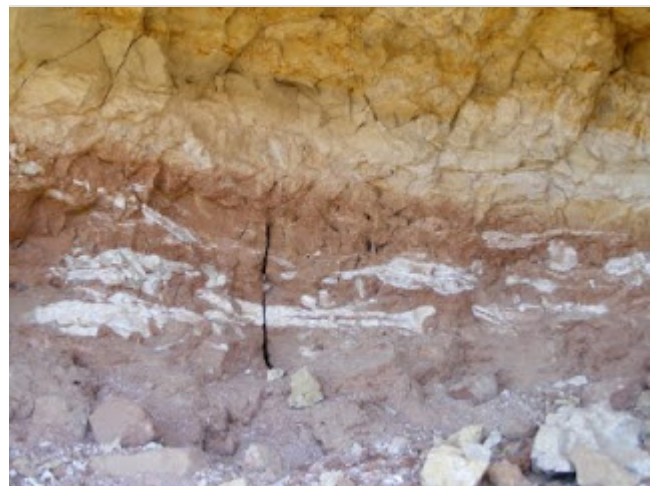
A la izquierda, varios hipparion. A la derecha, estrato con fósiles (E. Guillén)