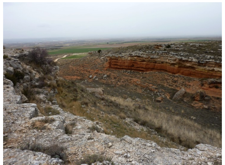
Dos imágenes del barranco de las Calaveras