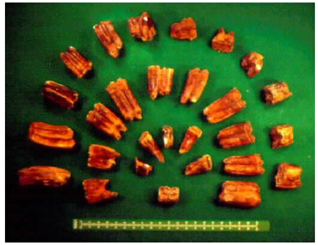
Esqueleto de Hipparion y huesos fósiles

La ruta comienza en Conclud. En varias zonas del pueblo, hoy barrio de Teruel, se exponen murales con animales que habitaron el entorno hace 7 millones de años. Desde la plaza de la iglesia, después de visitar los murales, iremos corriendo hasta el barranco de las Calaveras y el Cerro de la Garita. Serán 6 km fáciles, por caminos (ida y vuelta). En el barranco y en el cerro debemos ser respetuosos con el entorno. Se trata de bienes de interés cultural.