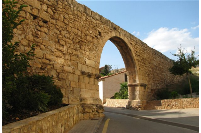
A la izquierda, fuente de la plaza de la Catedral (junto a la casa del Déan). Es una de las fuentes que dispuso Pierres Vedel por la ciudad, si bien su emplazamiento inicial no era el actual; a la derecha, el "arcillo" del carrel, otro de los acueductos de la conducción.