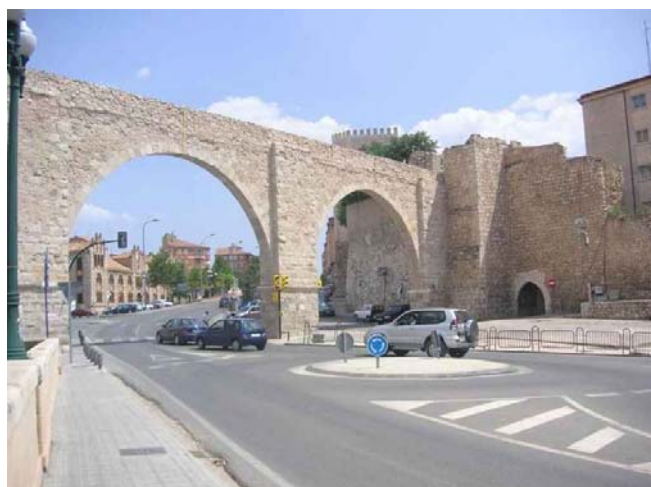
Acueducto de Los Arcos, en la parte final de la conducción, antes de la distribución del agua por el interior de Teruel.