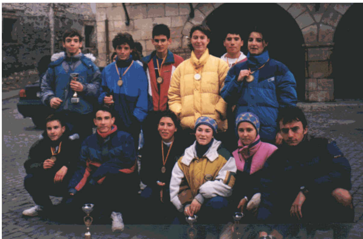
Equipo cadete y juvenil - ORIHUELA 95

Como todos los componentes de la Sección de Atletismo sabéis bien, la mejora individual, la superación diaria es lo más importante. En este boletín tenéis vuestro órgano de expresión y el reflejo de vuestro trabajo. Nuestro logotipo pertenece a una pintura paleolítica de Alacón (Teruel). Afortunadamente, correr ya no es sinónimo de sobrevivir, sino de vivir mejor.