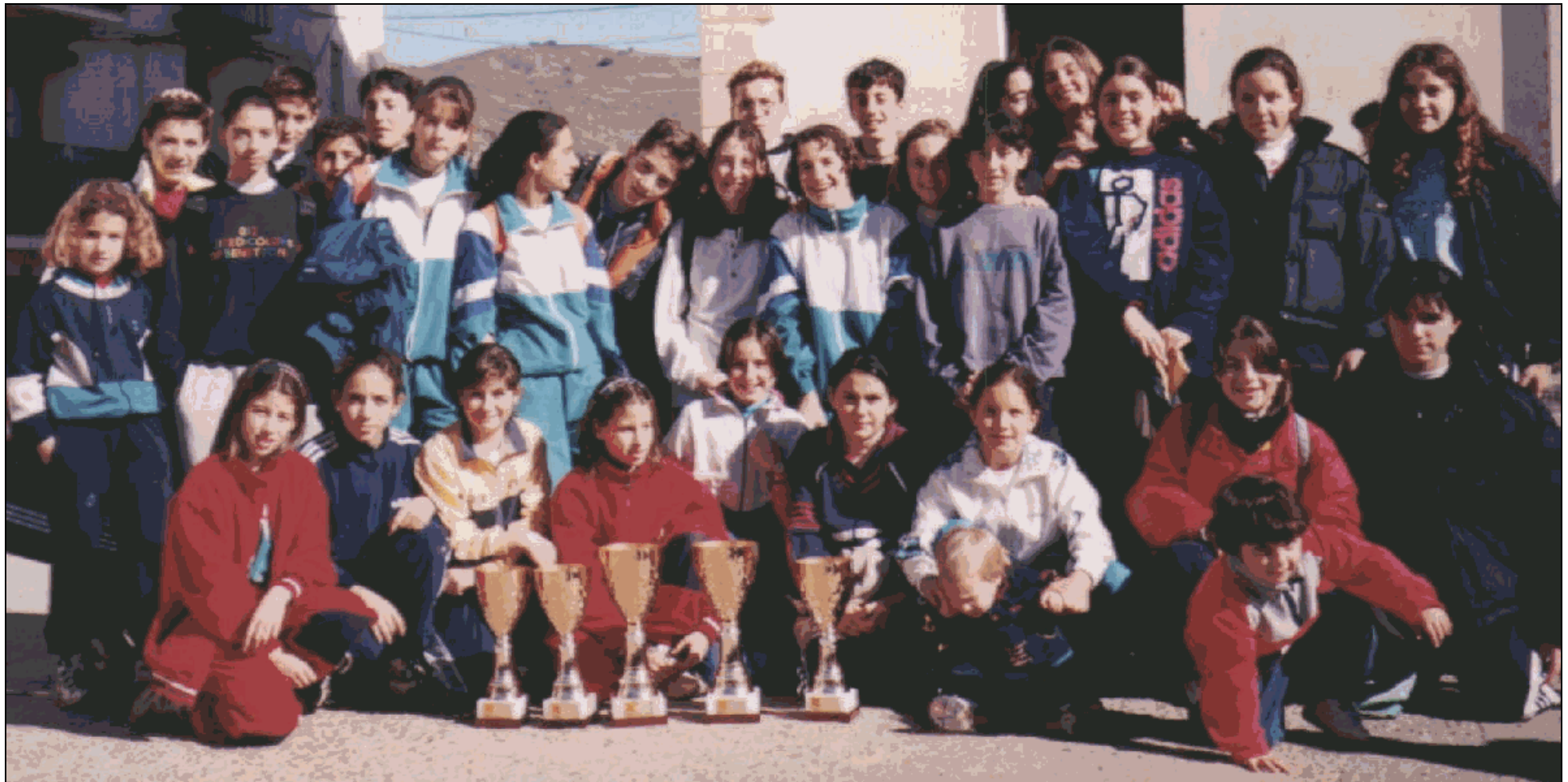
Alevines, infantiles y cadetes en Montalbán (enero de 1998)